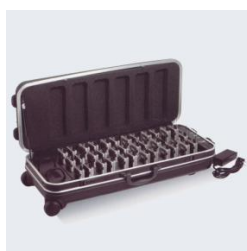
WALIZKO-ŁADOWARKA HDC-736 36 SZT. ODB./NAD.