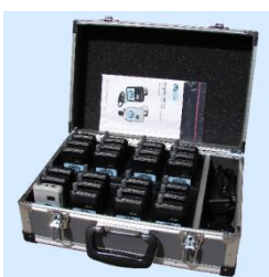
WALIZKO-ŁADOWARKA HDC-300 24 SZT. ODB./NAD.