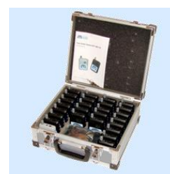
WALIZKA AC-300 26 SZT. ODB./NAD.