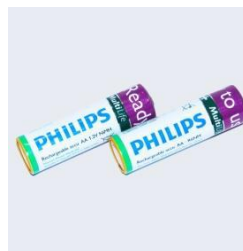
AKUMULATORKI PHILIPS MULTILIFE AA NiMH 2000mA