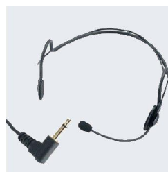
MIKROFON NAGŁOWNY HM-50A