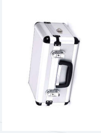
เป็นอุปกรณ์ชาร์จไฟและกระเป๋าเก็บอุปกรณ์