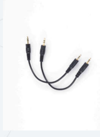
เป็นสายต่ออุปกรณ์เสียงที่มี Port ต่อแบบแจ็ค