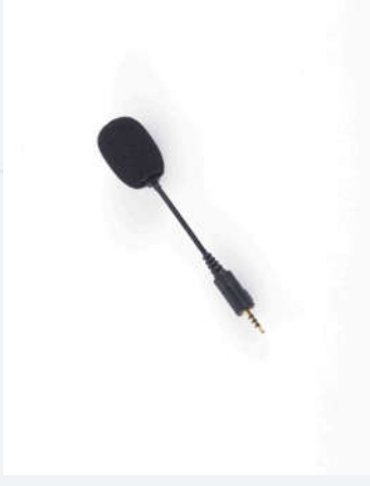
ไมโครโฟน