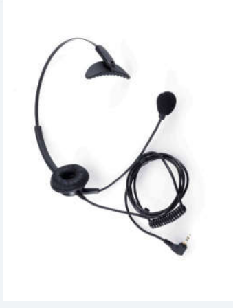
เป็นชุดหูฟัง + ไมโครโฟนแบบครอบ