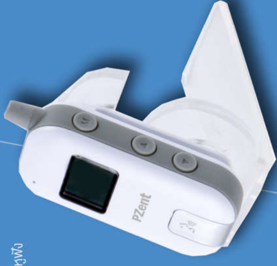
อุปกรณ์เป็นทั้งภาครับและภาคส่งในตัวเดียวกัน (Master/Slave)