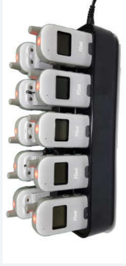
ขณะชาร์จแบตเตอรี่