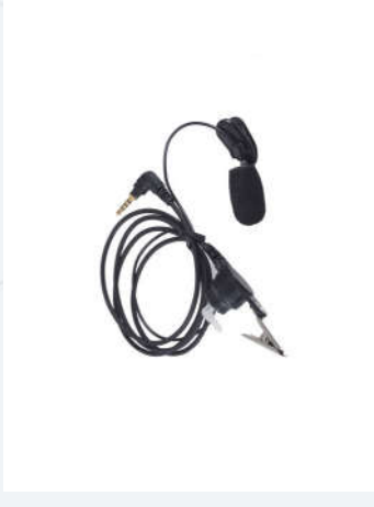
ไมโครโฟนแบบหนีบ